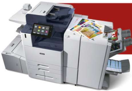
Xerox AltaLink 8100 Farb-Multifunktionsdrucker

Drucker, Kopierer und Multifunktionssysteme sind nach wie vor unverzichtbare Arbeitsmittel in einer modernen Büroumgebung. Beim täglichen Arbeiten bieten Ihnen unsere Produkte höchste Zuverlässigkeit und optimale Produktivität!